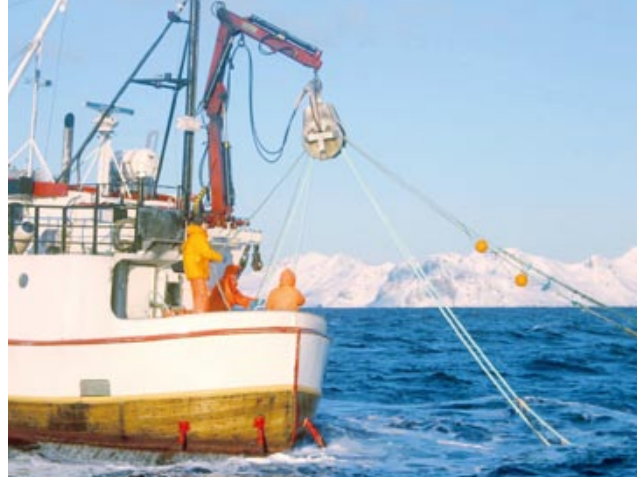
Im kristallklaren Wasser vor den Lofoten wird MSC-zertifizierte Fischerei für EDEKA betrieben