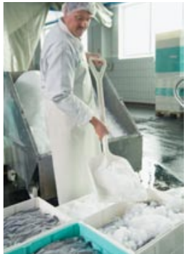
Der fangfrische Fisch wird gleich an Bord ausgenommen und bis zum Verzehr eisgekühlt