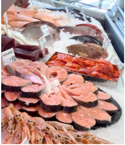
Das große Fischangebot bei EDEKA sorgt bei Feinschmeckern täglich für glänzende Augen

Wir essen immer mehr Fisch! Laut Statistik verzehrte bislang jeder Bundesbürger im Jahr durchschnittlich rund 16 kg Fisch und Meeresfrüchte. Richtig so, denn mit hochwertigem Eiweiß, hohem Jodgehalt und gesunden Fettsäuren zählt Fisch zu unseren gesündesten Lebensmitteln. EDEKA bietet Ihnen eine große Vielfalt der köstlichen Meerestiere. Frisch an der Fischtheke, tiefgekühlt oder mariniert. Das bleibt aber nur so, wenn keine Überfischung erfolgt. Deshalb engagiert sich EDEKA für den Schutz der Bestände und hat das Ziel, immer mehr Fisch aus nachhaltiger Fischerei zu beziehen.